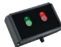
Fernbedienung Mod. Alle Bestellnr. TT01AC060 195.-