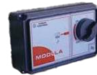
Fernbedienung Mod. Modula alle Bestellnr. TT01AC441