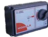
Fernbedienung Mod. Modula alle Bestellnr. TT01AC441